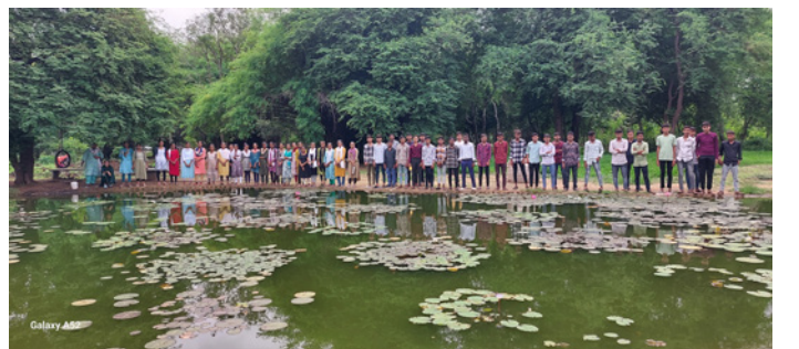
ડી.એલ.એડના પ્રથમ વર્ષના પ્રશિક્ષણાર્થીઓનું સંસ્થા દર્શન