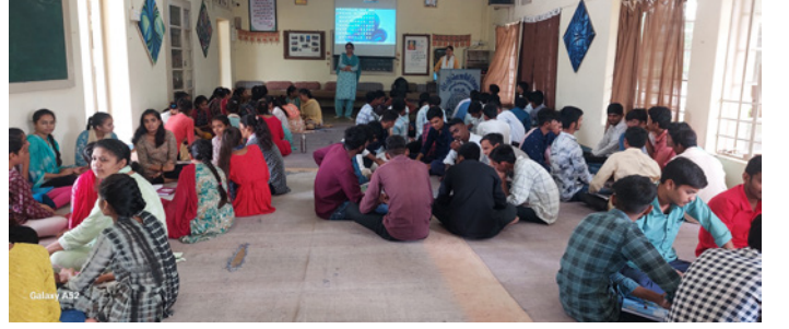
ડી.એલ.એડના બંને વર્ષના પ્રશિક્ષણાર્થીઓની મનોવૈજ્ઞાનિક શિબિર