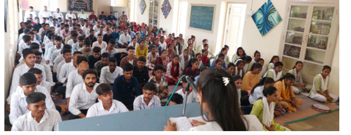
ડી.એલ.એડ પ્રથમ વર્ષનો પ્રવેશોત્સવ વર્ષ- 2024-25