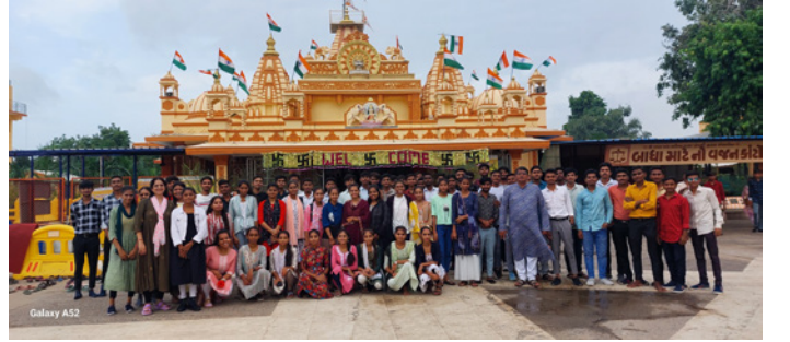
ડી.એલ.એડ વન ડે પિકનિક - અમદાવાદ દર્શન