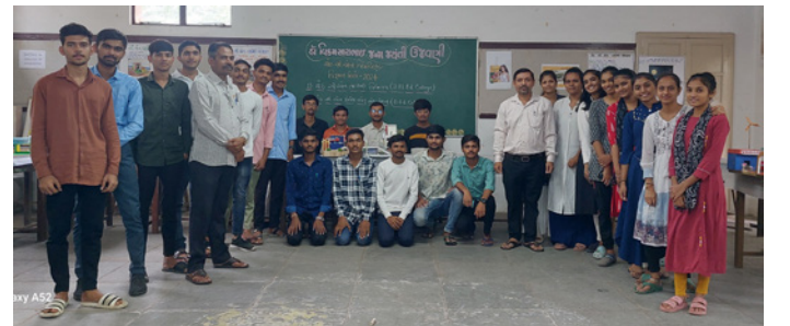
ડૉ. વિક્રમસારાભાઈ જન્મજયંતિ નિમિત્તે વિજ્ઞાનમેળો